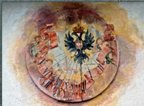
Haus St. Lukas