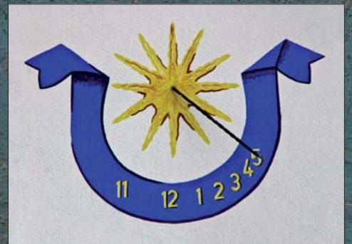
Haus Dr. Sauter